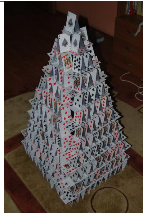
Primer pravih mojstrov.