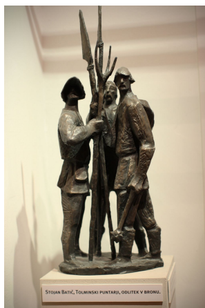
Stojan Batič, Tolminski puntarji