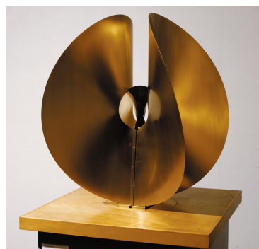
Naum Gabo, Spheric Theme

Kipe, v katerih pa NE prepoznamo podob iz sveta, ki nas obdaja, pa imenujemo nepredmetni kipi .