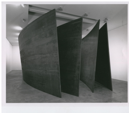
Richard Serra, Intersection 1992