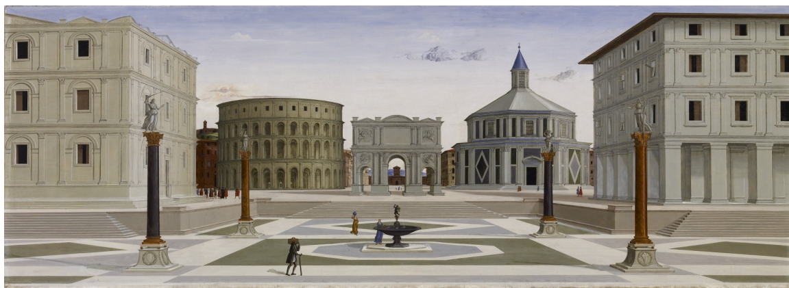
Fra Carnevale (pripisano), Idealno mesto, okoli leta 1480, olje in tempera