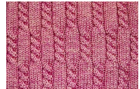
RITMIČNO NIZANJE NA PLETENINI