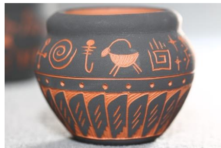
RITMIČNO NIZANJE ELEMENTOV NA LONČENI VAZI