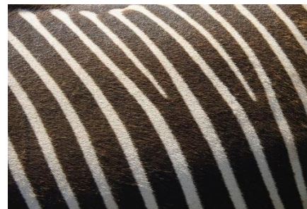
RITEM NA ZEBRINI DLAKI