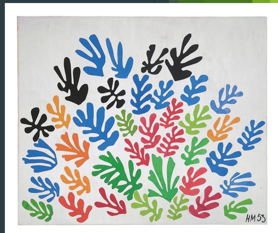
Henri Matisse, The Sheaf, 1953