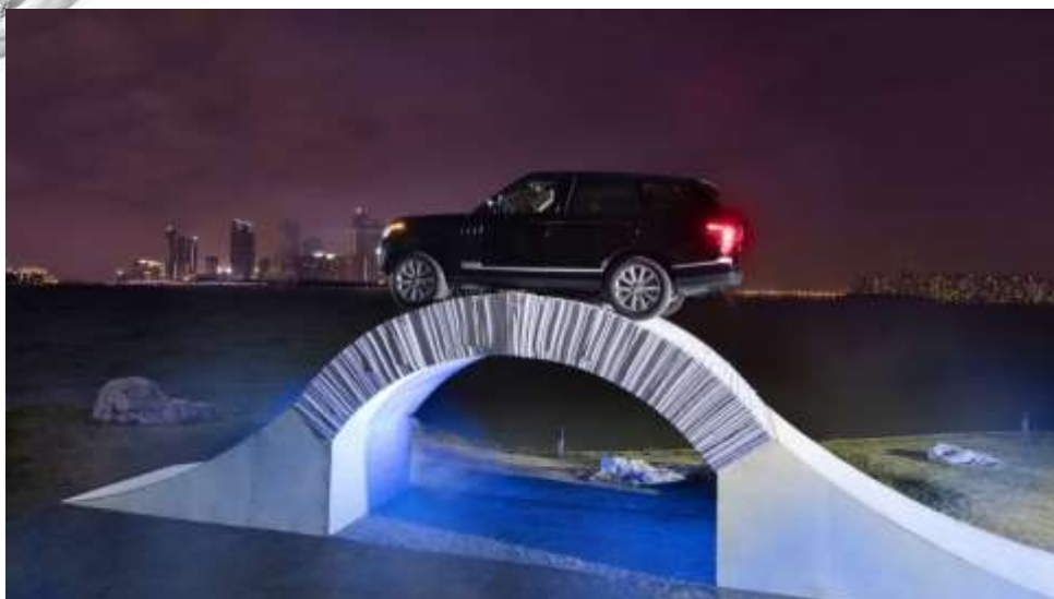
most iz papirja preko katerega pelje pravi Range Rover NEVERJETNO!