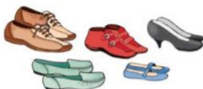
obutev za vsakdanjo rabo