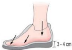
Pravilno oblikovana obutev

Čevlje je najbolje kupovati v popoldanskih urah, ker imamo takrat stopala nekoliko otečena, sicer se nam lahko zgodi, da kupimo premajhne čevlje. Pred nakupom je pomembno, da pomerimo oba čevlja ter se v njima malce sprehodimo. Tako se res prepričamo, ali nam obutev ustreza.