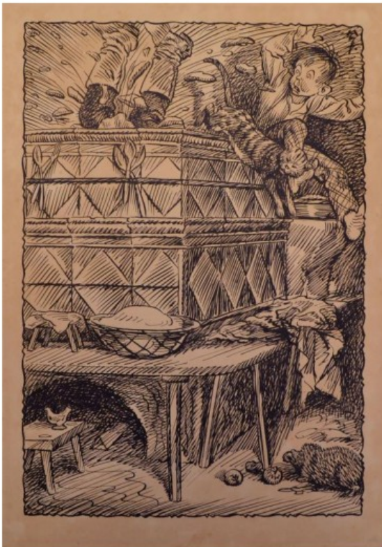
Hinko Smrekar, Risba, 1900-1942