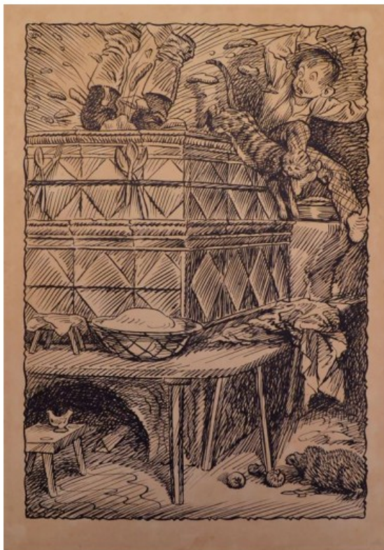
Hinko Smrekar, Risba, 1900-1942