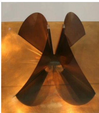
Naum Gabo, Spheric Theme

So pa tudi kipi, ki ne posnemajo vidnega sveta, predstavljajo pa likovne odnose. Raziskujejo formo (obliko). S temi odnosi umetniki izražajo svoja najgloblja čustva. Takšnim kipom pravimo nefiguralni ali abstraktni kipi . Abstraktni kipi ne upodabljajo realnih podob predmetov, živali, človeka,..., ampak se igrajo z likovnimi odnosi. Na gledalca naredijo vtis z igro barv, različnih oblik, uporabo modernih materialov, zanimivo postavitvijo in kaj je še zanimivo, vsak si jih lahko razlaga po svoje. Abstraktno kiparstvo je na videz svobodno in neformalno. Abstraktni kipi puščajo gledalcu več prostora za njegov osebni pogled. Poenostavljanje imenujemo s tujko abstrahiranje (abstrahere (lat.) = vzeti stran). Abstraktno kiparstvo je del moderne, sodobne umetnosti, kjer se za oblikovanje kipov uporabljajo novi materiali ter različni načini obdelave kipa. Materiali, iz katerih oblikujejo abstraktni kiparji, so najrazličnejši - kamen, bron, jeklo, les, umetne mase, aluminij, tkanine, vrvi, naravni materiali... Pri abstraktnih kipih velikokrat izvemo, kaj je kipar želel sporočiti šele, ko preberemo naslov umetniškega dela.