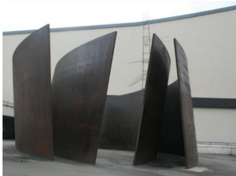
Richard Serra, Intersection 1992