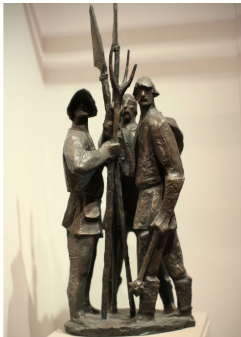
Stojan Batič, Tolminski puntarji