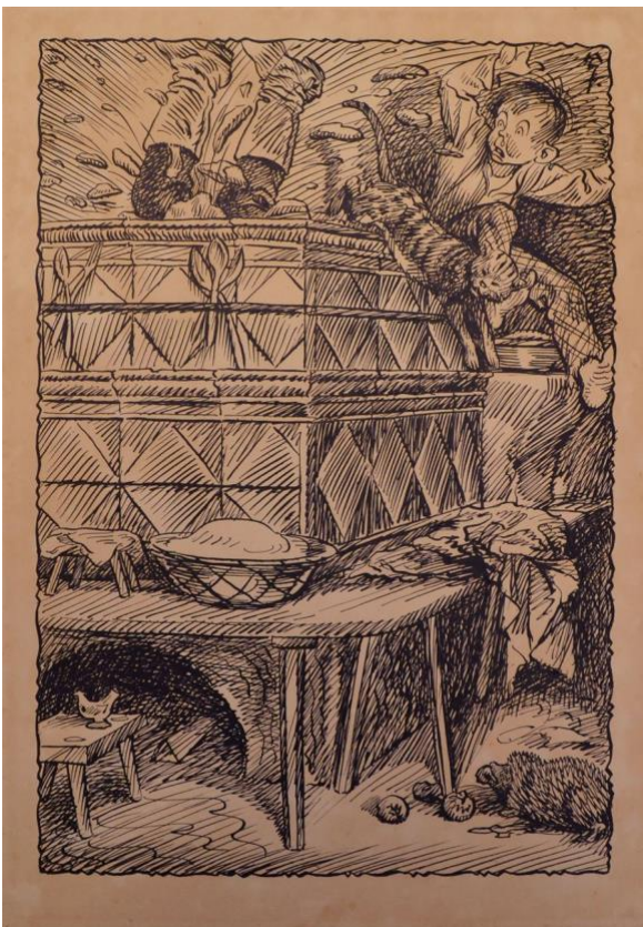
Hinko Smrekar, Risba, 1900-1942