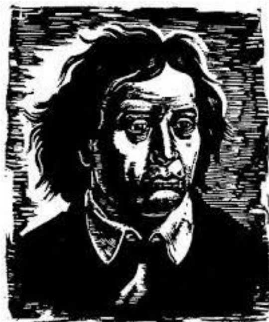
France Mihelič, France Prešeren, 1945