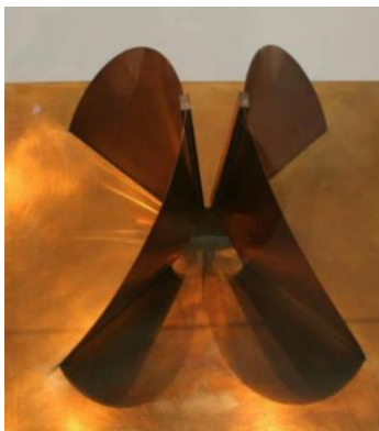
Naum Gabo, Spheric Theme

So pa tudi kipi, ki ne posnemajo vidnega sveta, predstavljajo pa likovne odnose. Raziskujejo formo (obliko). S temi odnosi umetniki izražajo svoja najgloblja čustva. Takšnim kipom pravimo nefiguralni ali abstraktni kipi . Abstraktni kipi ne upodabljajo realnih podob predmetov, živali, človeka,..., ampak se igrajo z likovnimi odnosi. Na gledalca naredijo vtis z igro barv, različnih oblik, uporabo modernih materialov, zanimivo postavitvijo in kaj je še zanimivo, vsak si jih lahko razlaga po svoje. Abstraktno kiparstvo je na videz svobodno in neformalno. Abstraktni kipi puščajo gledalcu več prostora za njegov osebni pogled. Poenostavljanje imenujemo s tujko abstrahiranje (abstrahere (lat.) = vzeti stran). Abstraktno kiparstvo je del moderne, sodobne umetnosti, kjer se za oblikovanje kipov uporabljajo novi materiali ter različni načini obdelave kipa. Materiali, iz katerih oblikujejo abstraktni kiparji, so najrazličnejši - kamen, bron, jeklo, les, umetne mase, aluminij, tkanine, vrvi, naravni materiali... Pri abstraktnih kipih velikokrat izvemo, kaj je kipar želel sporočiti šele, ko preberemo naslov umetniškega dela.