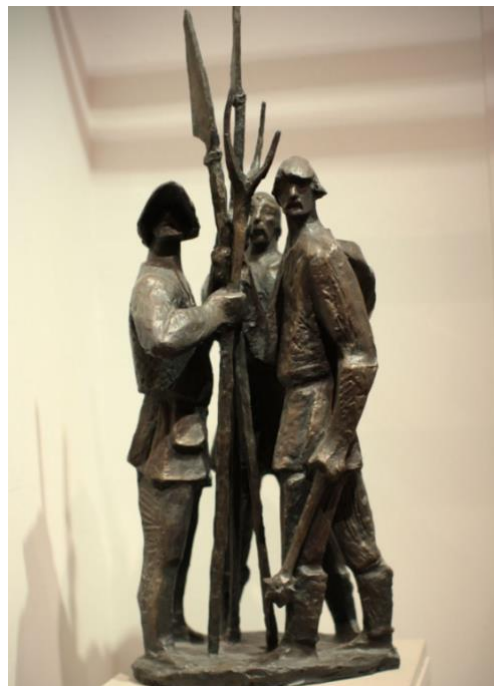
Stojan Batič, Tolminski puntarji