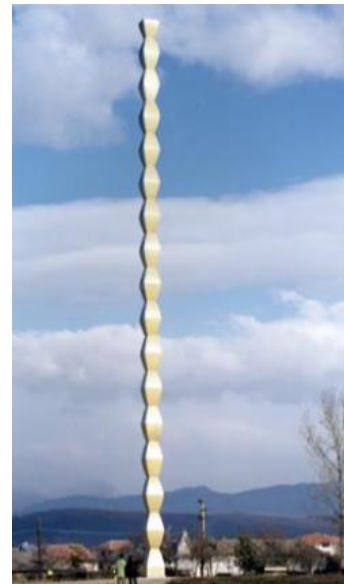
Constantin Francusi, Neskončni steber