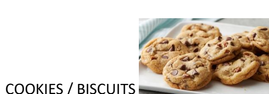
COOKIES / BISCUITS